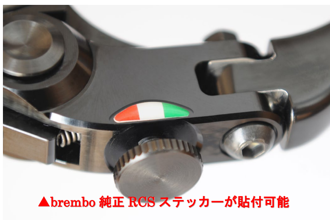
▲brembo 純正 RCS ステッカーが貼付可能