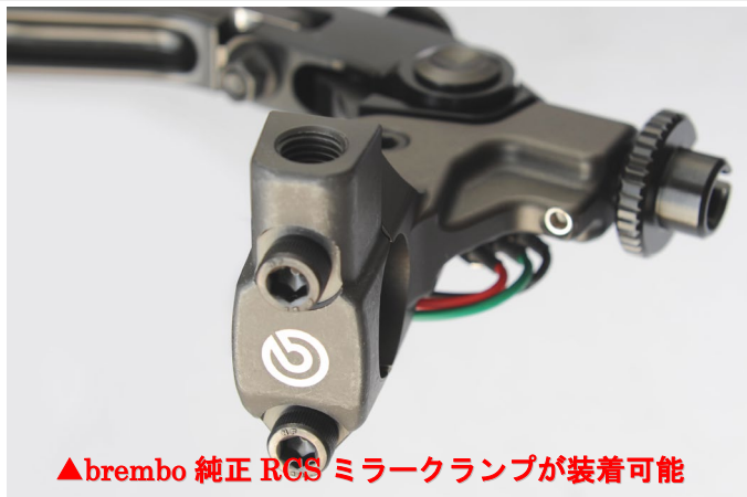
▲brembo 純正 RCS ミラーランプが装着可能